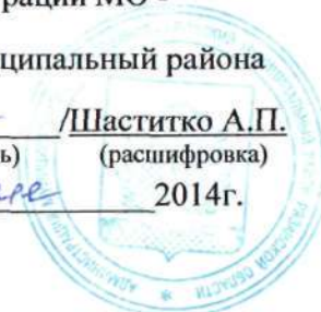
График временного отключения потребления по ООО "Новомичуринские Электрические Сети" на 2014-2015 годы (наименование вторичного получателя команд об аварийных ограничениях-ТСО)